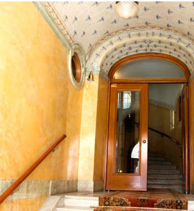
DET ENA AV FASTIGHETENS TRE TRAPPHUS VAR PAMPIGT OCH ELEGANT MED GUL STUCCO LUSTRO PÅ VÄGGARNA.