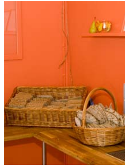
DEN VITA VÄGGEN MÅLADES ORANGE OCH BRÖDEN LAS I HÄRLIGA KORGAR I STÄLLET FÖR I TRISTA PAPPKARTONGER.