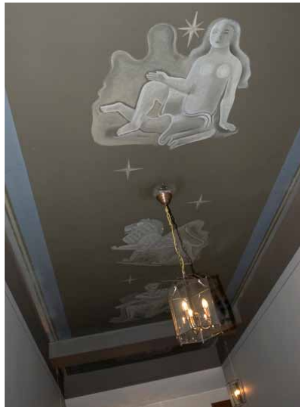
... MEDAN ENTRÉN PÅ NR 3 GÅR I GRÅTT, SVART OCH BLÅTT.