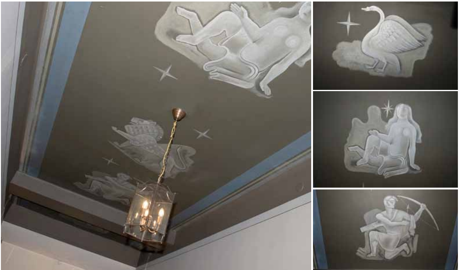
DE ORIGINELLA TAKMÅLNINGARNA FRÅN 1930-TALET HAR OLIKA STJÄRNTECKEN SOM MOTIV.