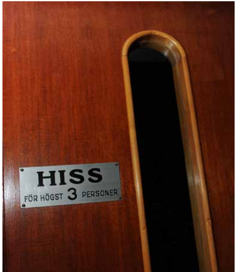
HISSDÖRRARNA ÄR GJORDA I TVÅ OLIKA TRÄSLAG.