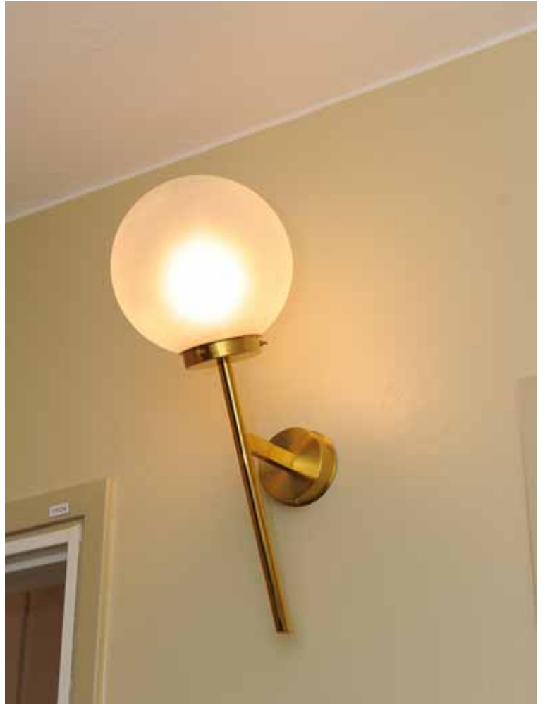
ÄRMATURERNA ÄR NYTILLVERKADE KOPIOR EFTER ORIGINALEN.