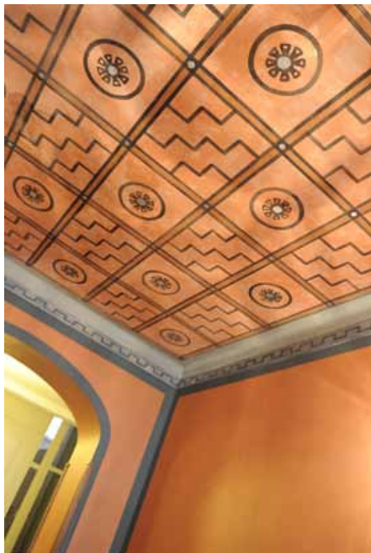
ENTRÉN PÅ ÄLVSBERGSGATAN 1 GÅR I ORANGERÖTT...