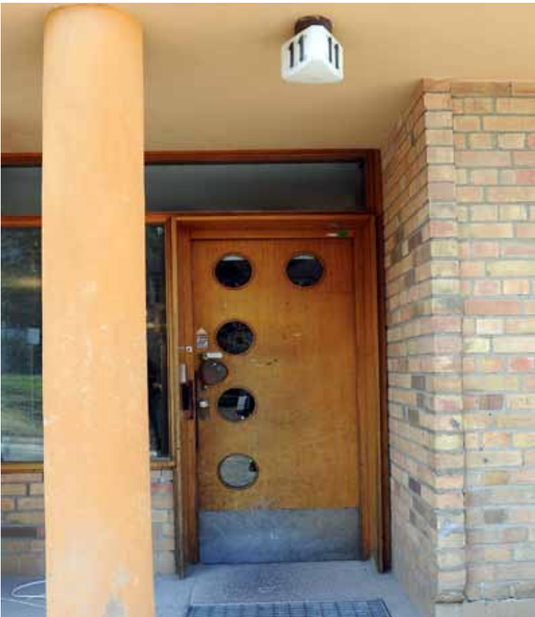
PORTEN HAR ETT SPECIELLT FORMSPRÅK OCH SKA NU RENOVERAS.