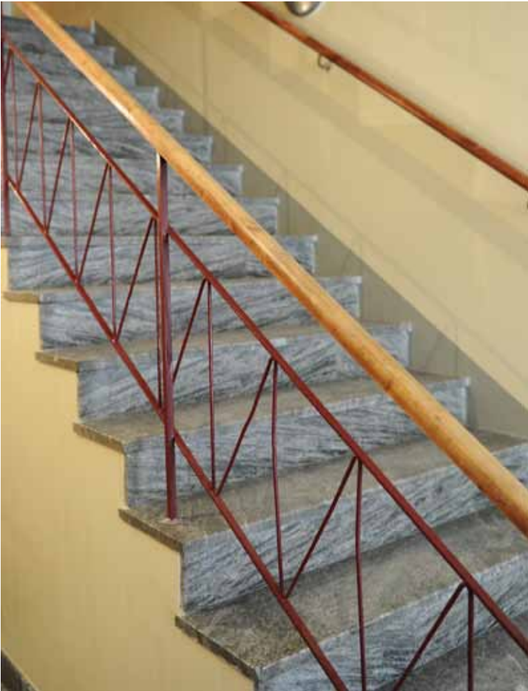
DEN GULA KULÖREN I TRAPPHUSET ÄR SAMMA SOM DEN URSPRUNGLIGA PÅ 40-TALET.