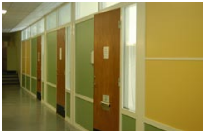
PÅ FARSTA GYMNASIUM HAR KORRIDORERNA FRÄSCHATS UPP. VÄGGSKIVOR HAR MÅLATS I GULT OCH GRÖNT. TILLSAMMANS MED DE RÖDBRUNA DÖRRARNA BILDAS ETT DEKORATIVT MÖNSTER I KORRIDOREN.

Det blev ett helhetstänkande, en snabb process, och oväntade färger. Vi visste att vi ville ha det ljust och fräscht. Nu är vi väldigt glada att det blev lite mer färg och djärvare kulörer än vad vi hade tänkt från början.