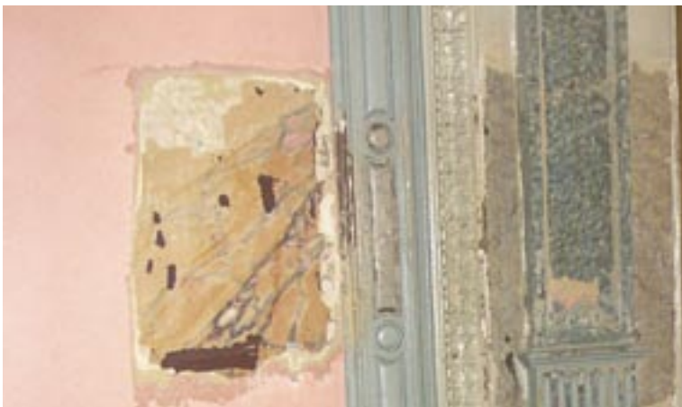
STEG ETT BLEV ATT SKRAPA FRAM DE OLIKA LAGREN AV FÄRG FRÅN TIDIGARE OMMÅLNINGAR.