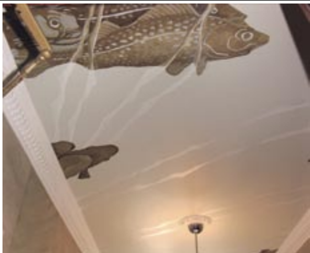
EN BOSTADSRÄTTSFÖRENING PÅ JUNGFRUGATAN I STOCKHOLM KOM MED EN SKISS TILL ALVIKS MÅLERI OCH BESTÄLLDE DEN HÄR TAKMÅLNINGEN. RESULTATET BLEV EN ANNORLUNDA OCH STÄMNINGSSKAPANDE ENTRÉ.

Fler och fler tecknar serviceavtal med ett måleri för att hålla målade ytor fräscha. En målare kommer regelbundet och inspekterar och bättrar sedan utsatta partier efter behov. Det är ett kostnadseffektivt sätt att öka trivselen och även målningens livslängd.