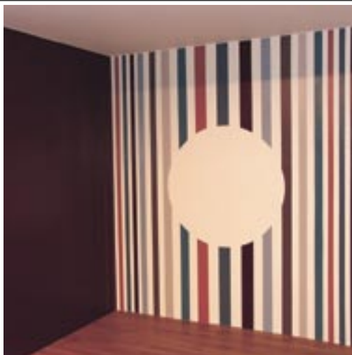
EN RANDIG VÄGGMÅLNING FRÅN EN UTSTÄLLNING PÅ ALVIKS MÅLERI.