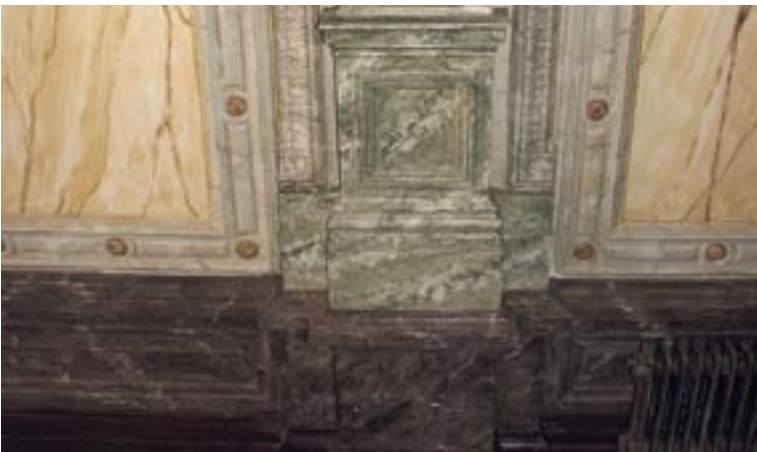
ATT EFTERLIKNA OLIKA STENAR SOM KOLMÅRDSSMARMOR, SIENNAMARMOR, BRUN KALKSTEN OCH LJUS KALKSTEN ÄR ETT ARBETE SOM KRÄVER STOR YRKESKICKLIGHET AV MÅLAREN.