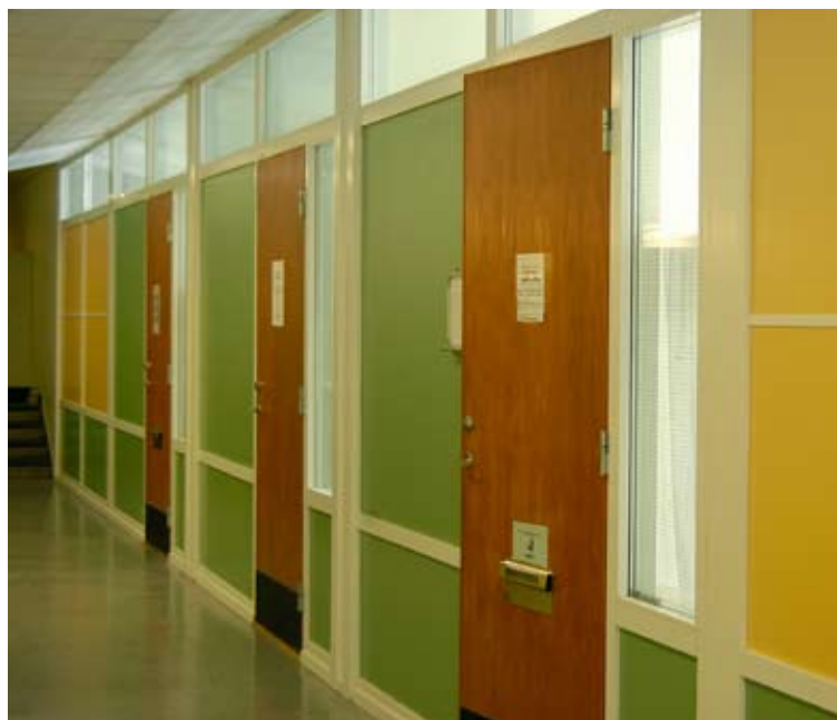
FARSTA GYMNASIUM HAR BLIVIT MER FÄRGSTARKT. DE RÖDBRUNA DÖRRARNA HAR FÅTT SÄLLSKAP AV GULT OCH GRÖNT. TILLSAMMANS BILDAR FÄRGERNA ETT DEKORATIVT MÖNSTER I KORRIDORERNA.