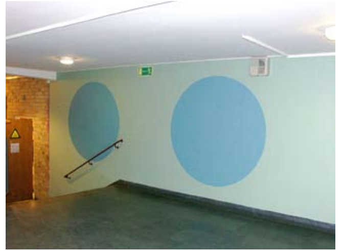
HÖKARÄNGSSKOLAN I FARSTA HAR FÅTT TURKOS CIRKLAR